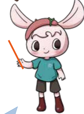
ひろびよん ©四谷ひろばキャラクター