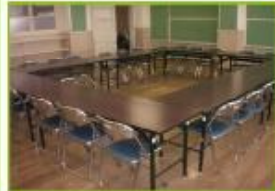
コミュニティルーム 1・2・5